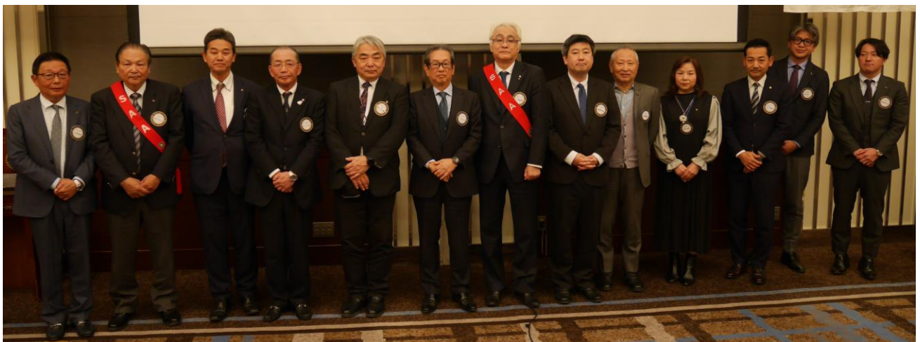
2025-26年度 理事役員の皆さま