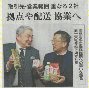
取引先・営業範囲 重なる2社 拠点や配送 協業へ